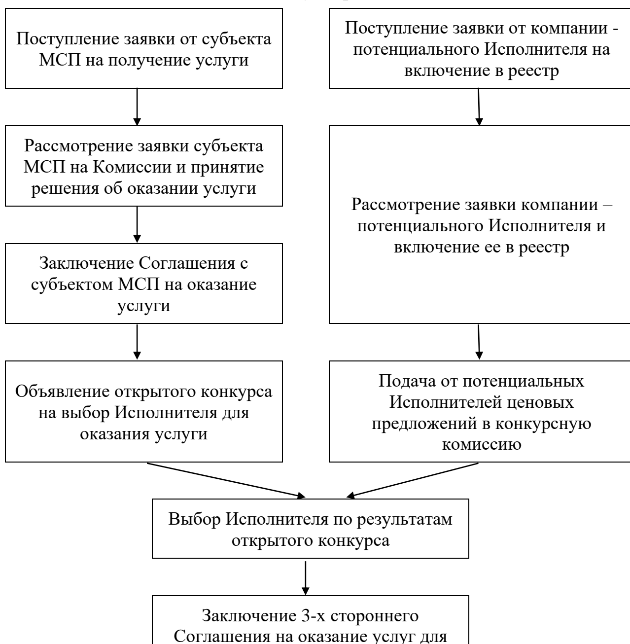
Схема взаимодействия с аутсорсинговыми компаниями

Для участия в реализации мероприятий, направленных на обеспечение деятельности Гарантийного фонда Бурятия, Центр поддержки предпринимательства может привлекать инжиниринговые, консалтинговые, аудиторские и иные организации для включения в Реестр компаний для участия в реализации мероприятий по предоставлению услуг физическим лицам и субъектам малого и среднего предпринимательства Фондом и заключения договоров на оказание услуг физическим лицам и субъектам малого и среднего предпринимательства Фондом.